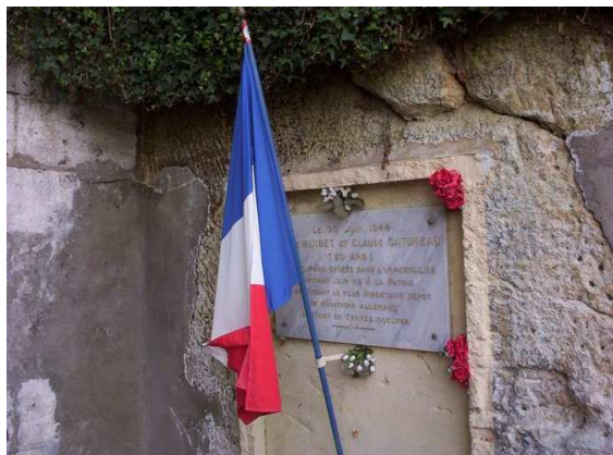
Plaque commémorative À l'entrée des carrières de Heurtebize à Jonzac