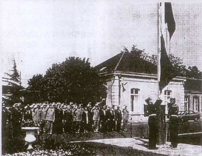
La levée des couleurs avec la participation de la musique du Prytanée.