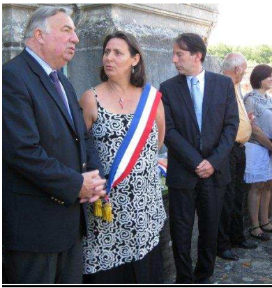
Mr G.Larcher, A.F.Gaillot et D. Fischer