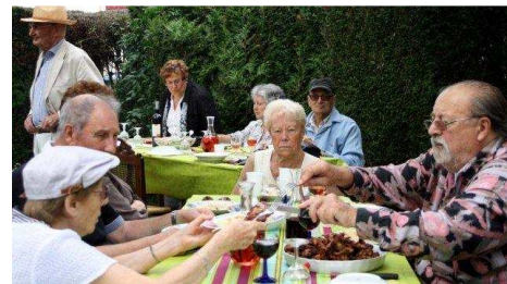
Tous, bien attablés, trinquons avant de commencer