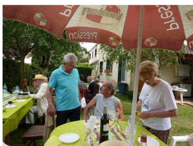
Le président se fait servir