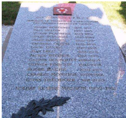
Tombe des élèves décédés pendant leur scolarité.