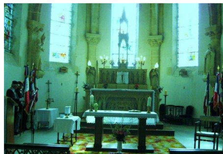
Cœur de l'église de La Boissière avec les porte-drapeaux