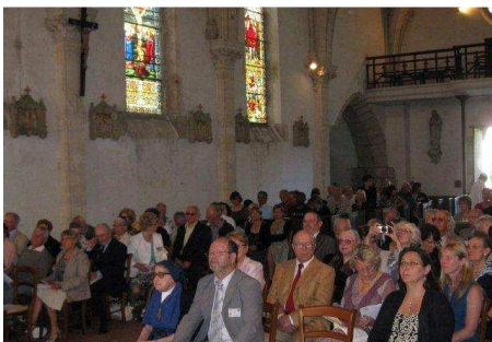
Un aperçu des anciens poussins à la messe